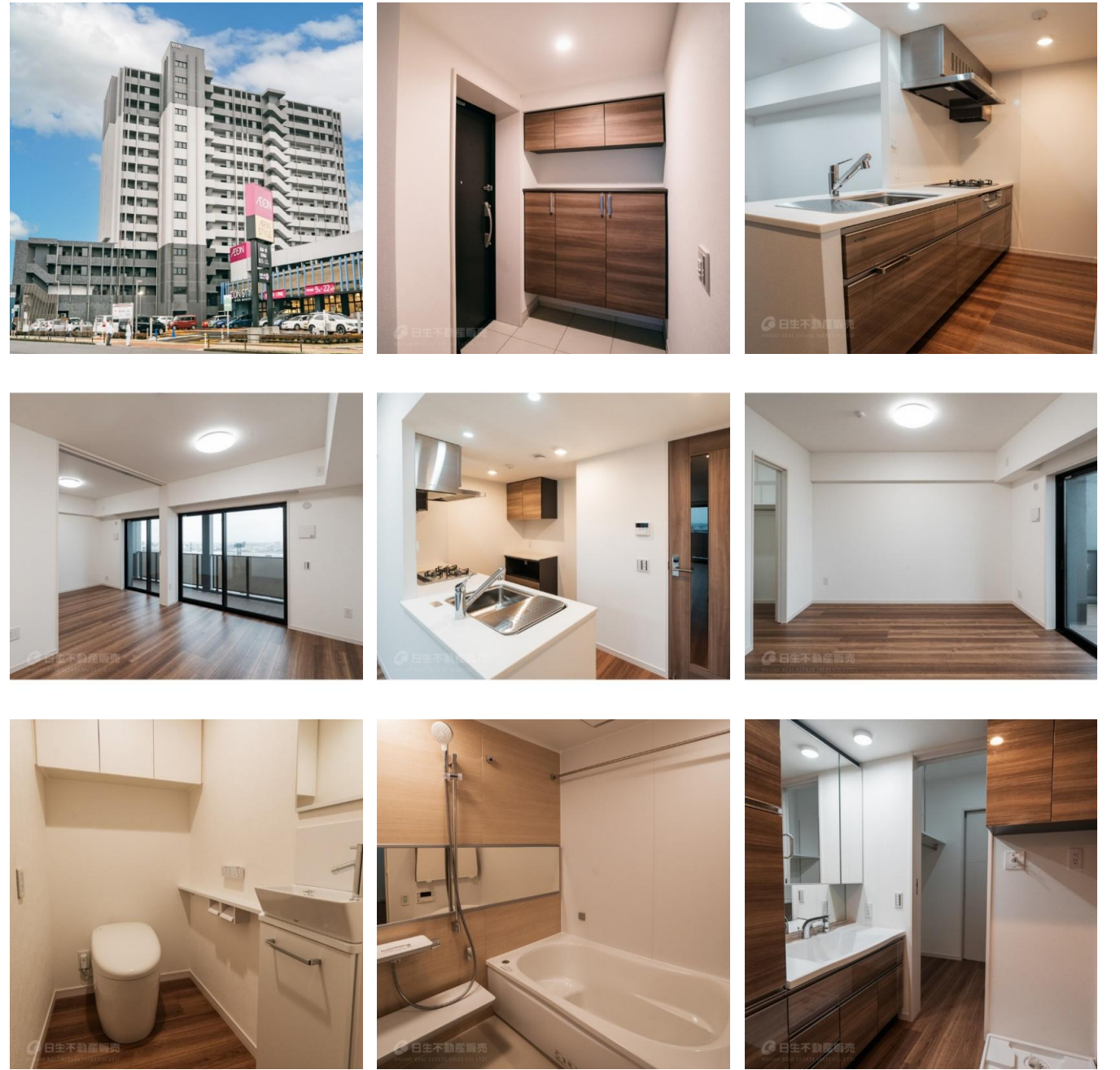
※掲載の写真は新築時入居前の写真です